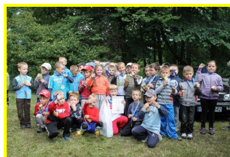
Chłopcy rocznik 2006-2005