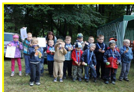
Chłopcy rocznik 2007-2008