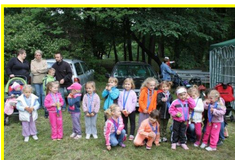
Dziewczynki rocznik 2007-2008