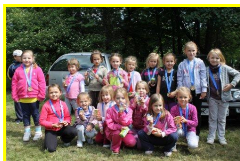
Dziewczynki rocznik 2006-2005